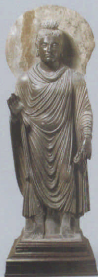
图 2 键陀罗石雕佛立像