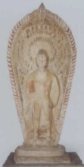
图 12 桓氏一族造石佛立像