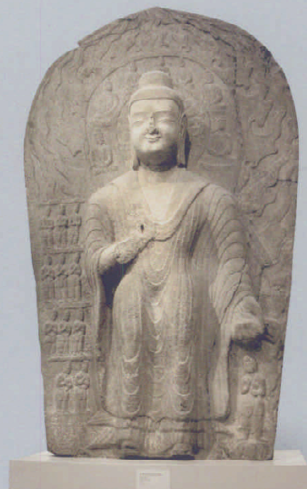
图 9 北魏定光佛立像