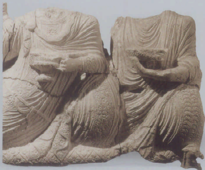
图5 叙利亚巴尔米拉犍堂图石雕像局部