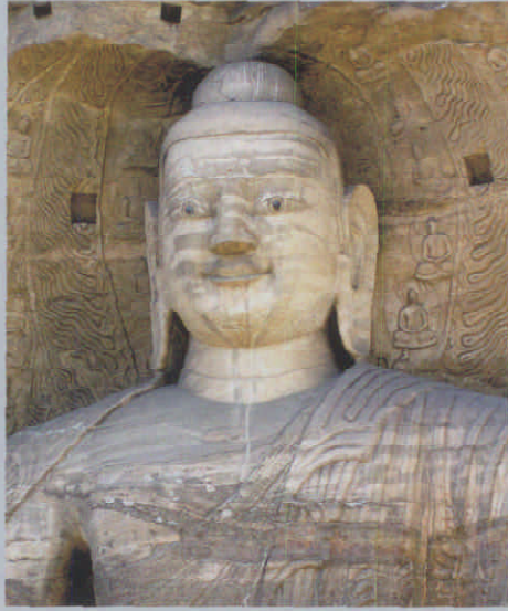
图7 云冈第20窟佛头部