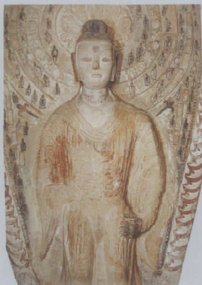
图 12 局部