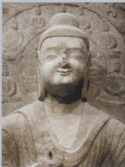
图 9 局部