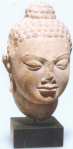
图3 印度马土腊式佛像 4世纪