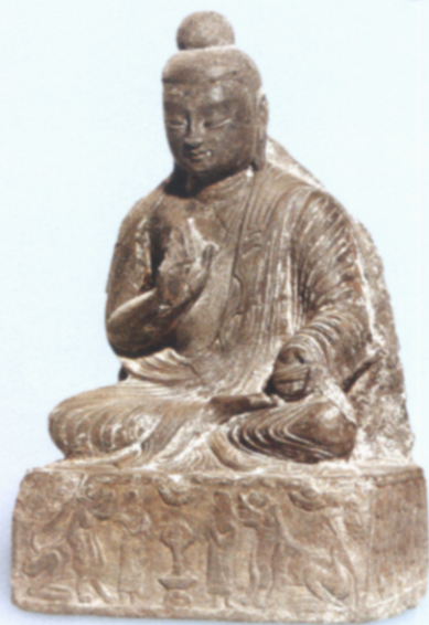
图6 冯受受造佛坐像