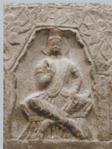
图 10 局部

此像胸前和上臂部之衣纹，呈U形平行分布，臂部衣纹与前述张永造像相同，分二叉如燕尾。衣纹为扁平状，上刻阴线一道。值得注意的是其双腿突显，两腿间衣纹呈U形，层层分布如水波涟漪。膝盖亦极力刻化，突起成圆球形。