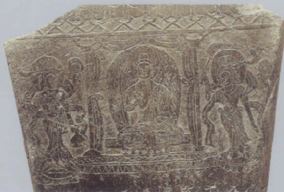
图 11 背面局部