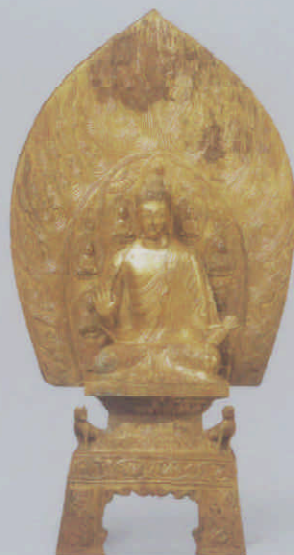
图 14 太和元年阳氏造释迦佛坐像