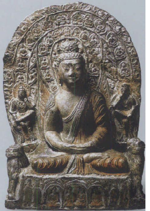
图1 北魏张永造石佛坐像