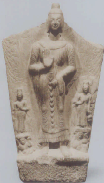
图 11 比丘僧欣造佛立像