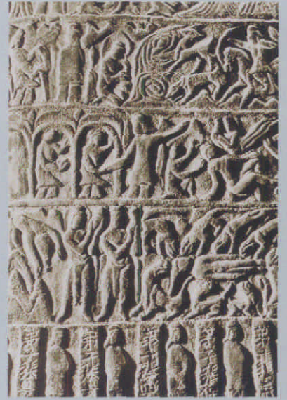
图1 背面的舍身饲虎图

白先生所谓的云冈早期造像溯自凉州的特征之一。张永造像和宋德兴造像的出土地不明,但从各方面风格分析,此像与云冈20窟大佛(图8)仍属同一系统的造像,估计是平城(大同)附近制作的。