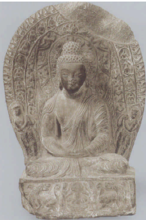
图4 太安三年宋禧兴造佛坐像