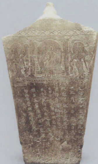
图 11 背面