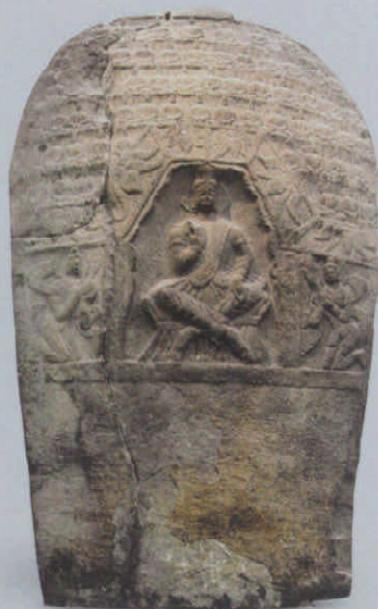
图 10 定光佛立像背面交脚菩萨