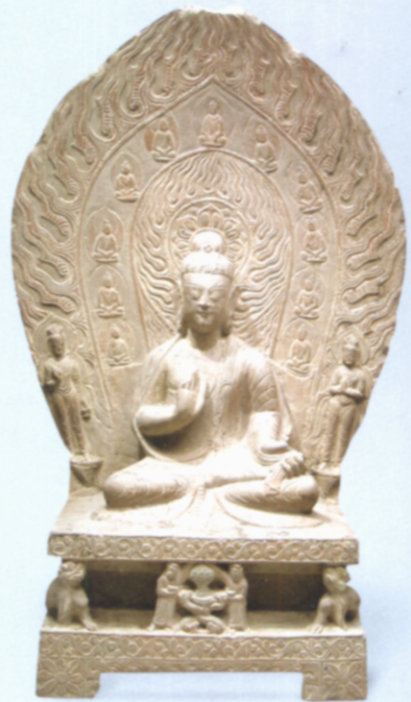
图13 尹受国造石佛坐像